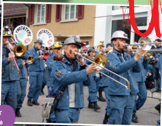
«Die Dorfgemeinschaft wird an unserer Dorffasnacht ganz besonders spürbar.»