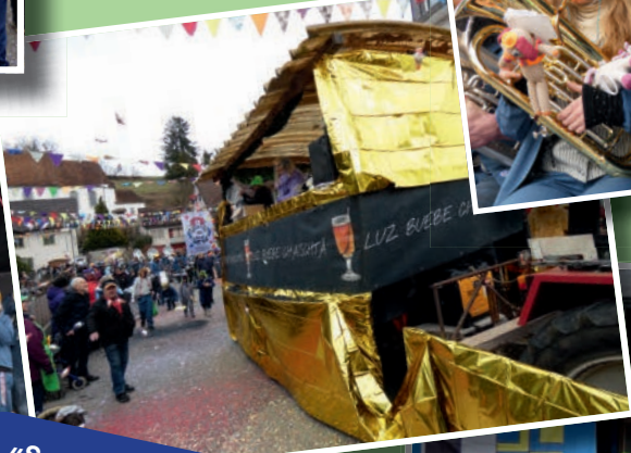
«So toll, dass auch Neuzuzüger spontan erklärt haben, sich für die Dorffasnacht einzubringen.»