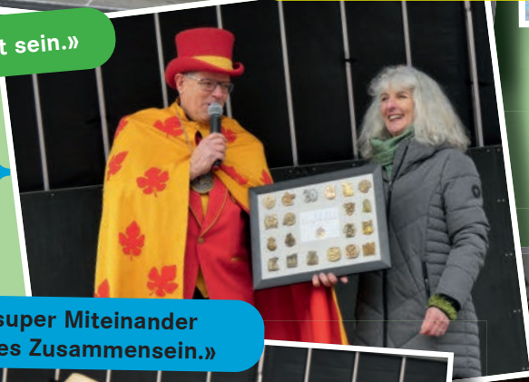
«Ein ist ein super Miteinander und ein lustiges Zusammensein.»