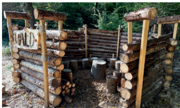
Nach einem Brand hatte das Waldsofa letztes Jahr neu gebaut werden müssen.