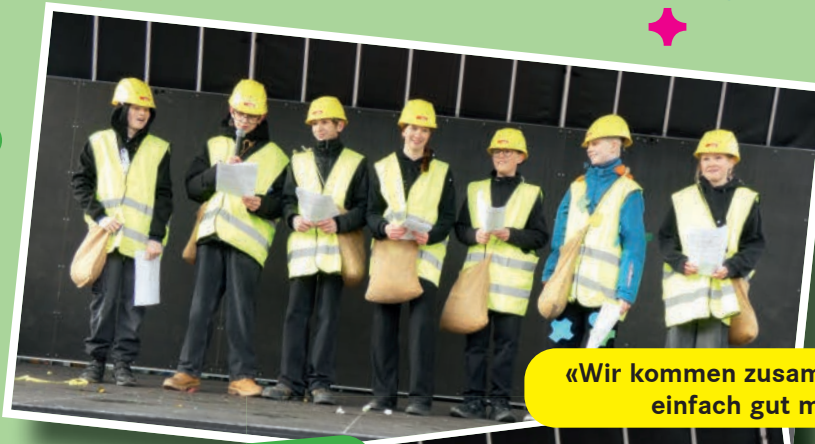
«Wir kommen zusammen und haben es einfach gut miteinander.»