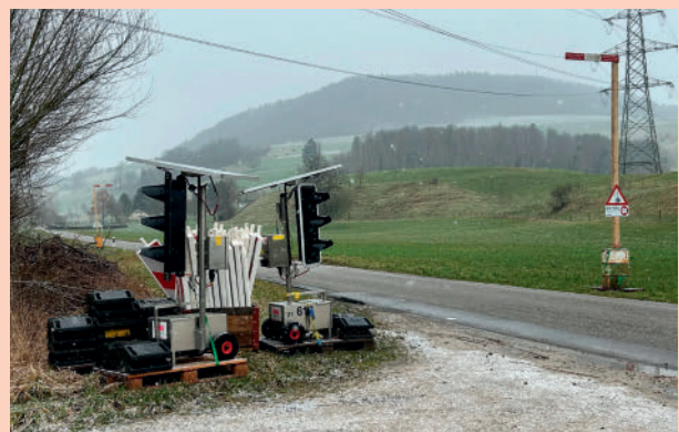
Entlang der Baustelle wird der Verkehr mit einer Lichtsignalanlage einspurig geführt werden.

Es ist geplant, die Strasse K464 auf eine Breite von 5,50m auszubauen. Es wird nicht möglich sein, den Ausbau in der heutigen Vermarktung umzusetzen. Auf der ganzen Projektlänge ist mit zirka 3000m 2 Landerwerb zu rechnen.