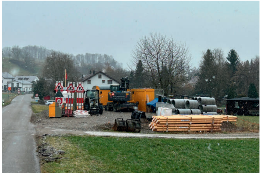
Offizieller Baustart war am 9. Februar und erste (Vorbereitungs-)Arbeiten konnten erfolgen.

wasser gefasst und abgeleitet. Mit der Sanierung wird die Strassenentwässerung partiell erneuert. Der Bachdurchlass «Bettlerhaubächli» wird auf die zukünftige Hochwassersituation umgebaut. Die Bushaltestelle «Steigstich» wird nach Behindertengleichstellungsgesetz umgebaut und erhält eine hohe Einstiegskante. Zudem wird ein Teil der Panzersperre abgebrochen, damit diese keine Gefahr mehr für den Verkehr darstellt. Die Unternehmung, Bauleitung und die Abteilung Tiefbau setzen alles daran, die Beeinträchtigungen während der Bauzeit möglichst gering zu halten und bitten die Verkehrsteilnehmenden sowie die Anwohnenden um Nachsicht für die unvermeidlichen Behinderungen.