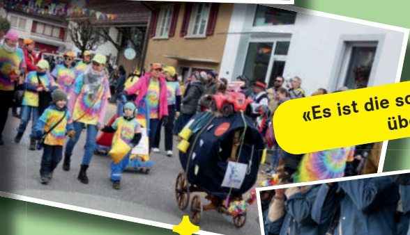
«Es ist die schönste Jahreszeit überhaupt.»