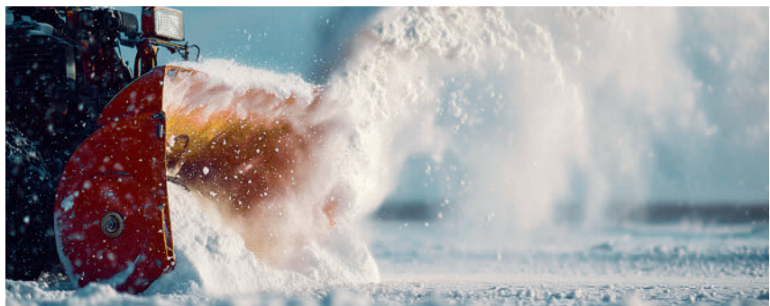
Rund 100 Stunden wurden diesen Winter in Kaisten für den Winterdienst aufgewendet.

Mit dem Winterdienst-Konzept der Gemeinde Kaisten wird der Winterdienst geregelt. Themen wie Räumtechnik, Winterdienst-Standards, Zuständigkeit usw. müssen die Mitarbeiter berücksichtigen. Auch Grundeigentümer können durch das frühzeitige Zurückschneiden von Bäumen und Sträuchern einen wichtigen Beitrag zum Winterdienst leisten. Liegt Schnee auf den Ästen, wird deutlich sichtbar, wie sorgfältig der Rückschnitt im Herbst durchgeführt wurde. Bei Fragen zum Winterdienst oder zum Zurückschneiden von Sträuchern und Bäumen geben die Unterhaltsbetriebe Kaisten gerne Auskunft.