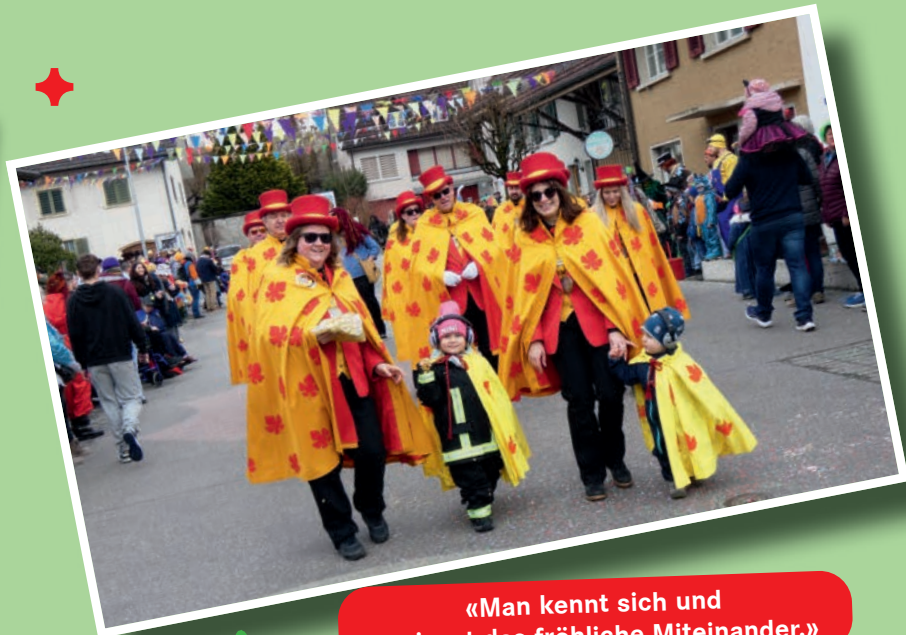
«Man kennt sich und genießt das fröhliche Miteinander.»