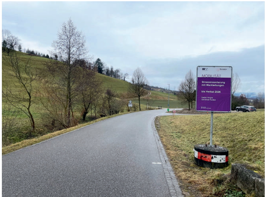
Die K464 wird dieses Jahr saniert.

Der Strassenabschnitt weist diverse Schäden auf, zum Beispiel Risse im Belag, abgedrückte Ränder und zerfahrenes Kulturland, weil die Fahrbahn zu schmal ist. Diese beträgt zwischen 4,60 m und 4,80 m. In den anschliessenden Abschnitten misst die Fahrbahn in Kaisten 6,00 m und