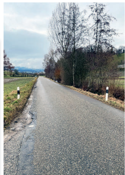
Die K464 ist aktuell zu schmal und muss verbreitert werden.