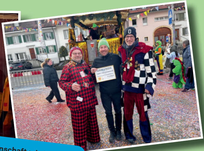
«Die Gemeinschaft wird gelebt.»