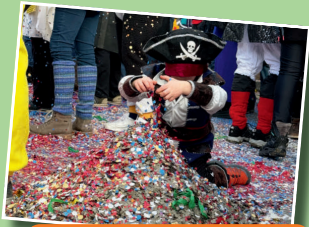
«Es ist klein, fein und einfach wunderbar.»